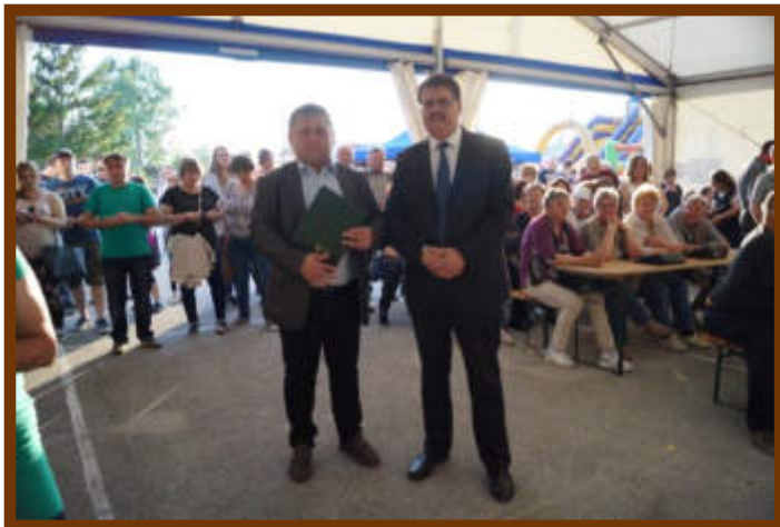
Megvezérlő átadás 2019-ben

A 2020-as évben a járvány vissza-visszatérő nehézségei ellenére az Identitás program pályázati