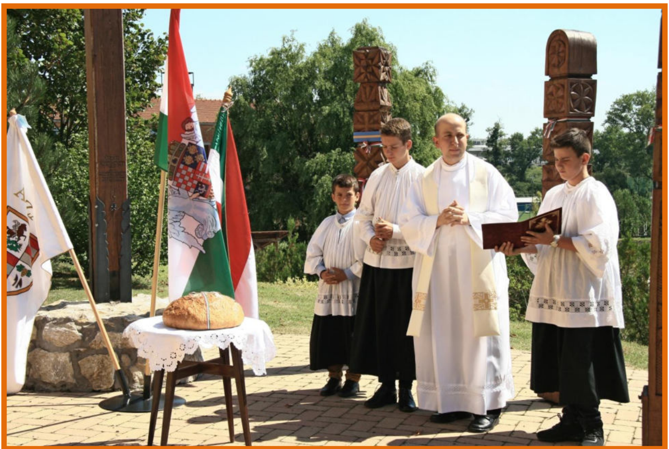
Pekár Zsolt polgármester

Magyar földön hagyomány, hogy ilyenkor megszenteljük, megszegjük, és megízleljük az Új kenyeret, mely hitünket jelzi, a bizakodást, hogy jövőre is lesz kenyerünk. Mindannyinknak kívánom, hogy így legyen. Isten éltesse a magyar hazát, Isten adjon nekünk mindig kenyeret! Isten áldja a magyarokat! Isten áldja Önöket, Ászáriakat!”